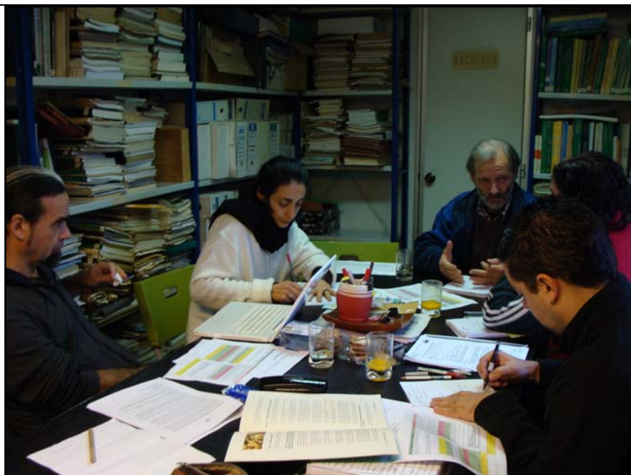
Foto 2. Compañeros francés e italiana en la reunión.