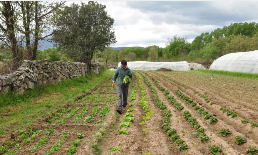
4 has de huerto de producción de verdura