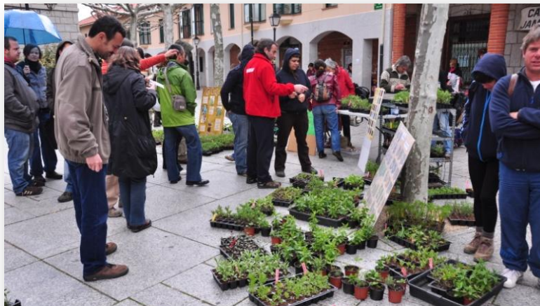
Devolver la agricultura a las plazas