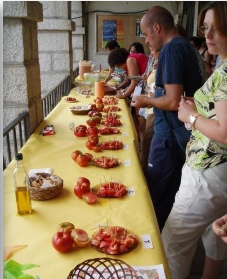
Cata-concurso de tomates