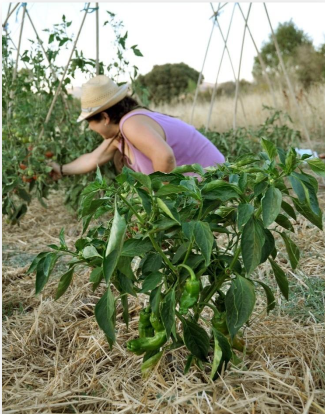
Huerto de multiplicación