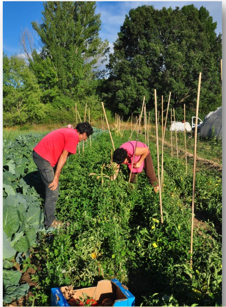
Selección de frutos para semilla