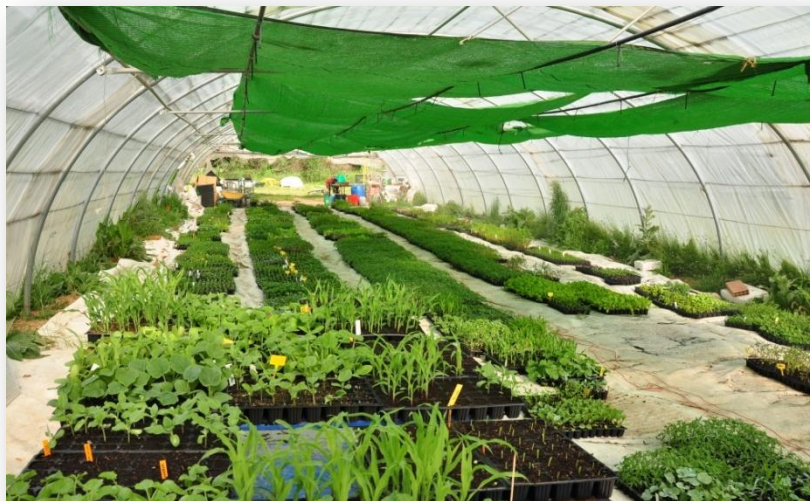
Invernadero y camas calientes