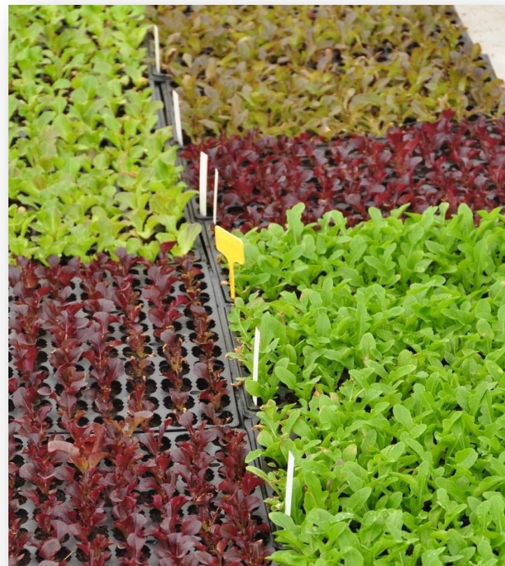
Diversidad: variedades tradicionales de la Sierra y de otras regiones