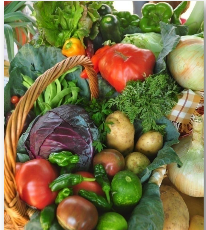
Venta directa de cestas