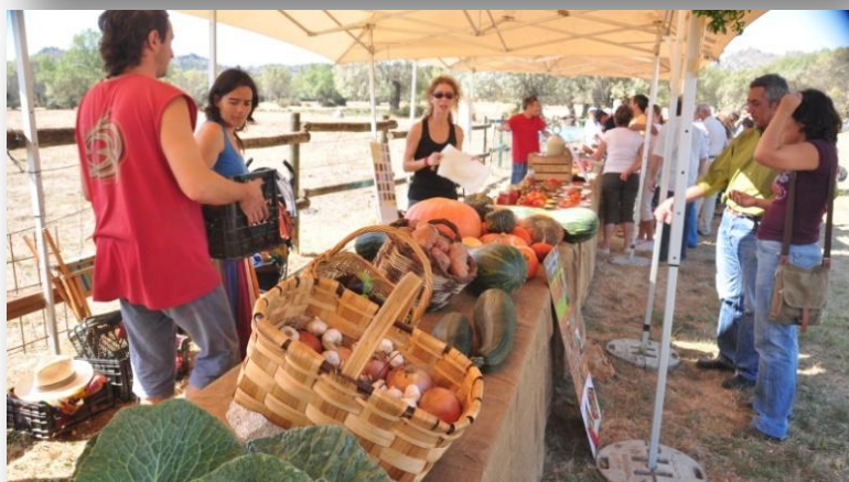
Feria de agricultura y ganadería