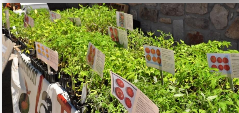
Distribución en mercadillos locales