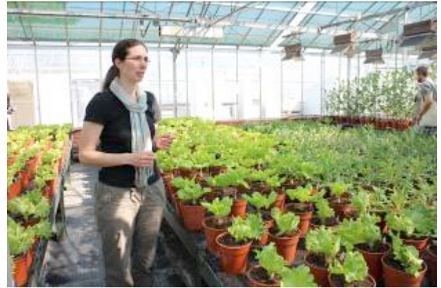
Viern. 16: Visita a HRI Wellesbourne. Warwick Genetic Resources Unit.