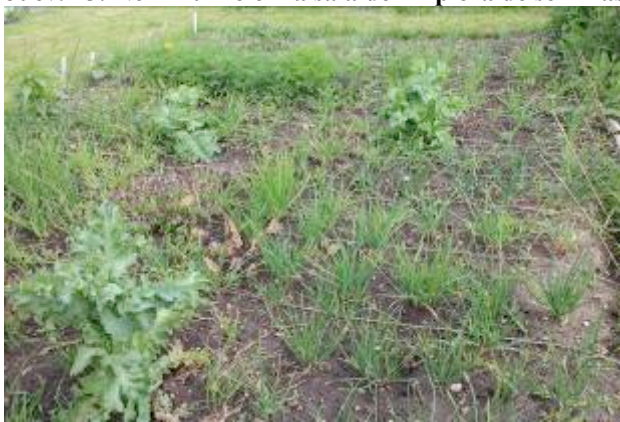
Juev. 15: cultivos exteriores Garden Organic