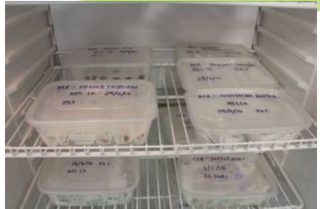
Juev. 15: cámara de germinación