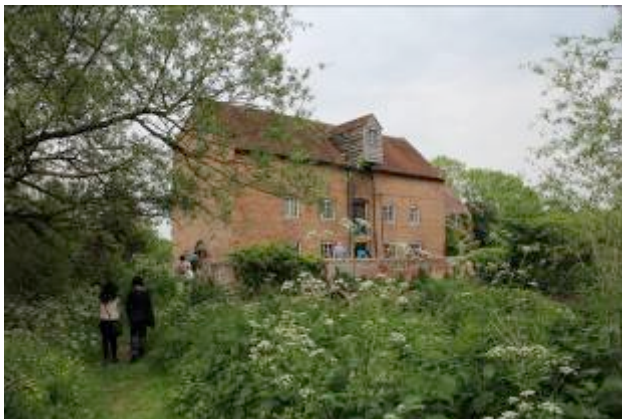
Viern. 16: Visita Molino de piedra de Charlecote.