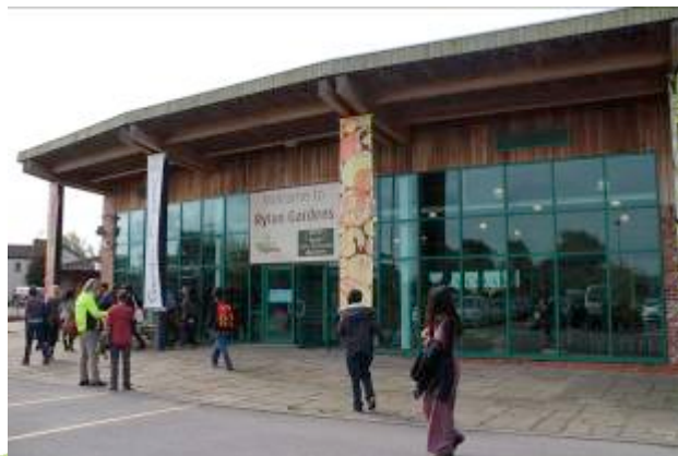
Juev. 15: Entrada principal Garden Organic