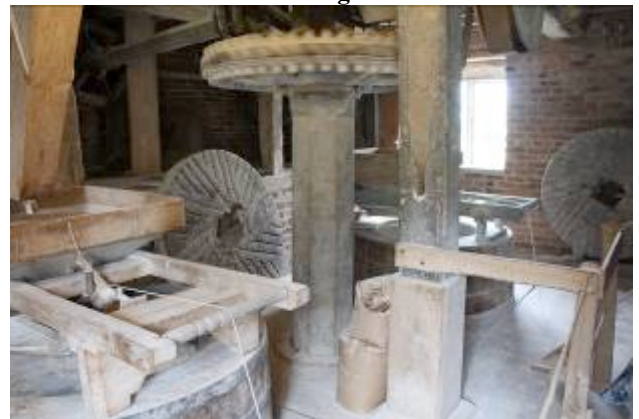
Viern. 16: Interior del molino de piedra.