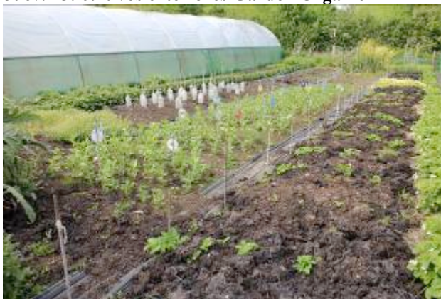
Juev. 15: Visita Feldon forest Farm. Finca colaboradora