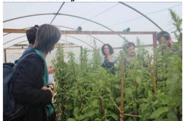
Juev. 15: Politunnel