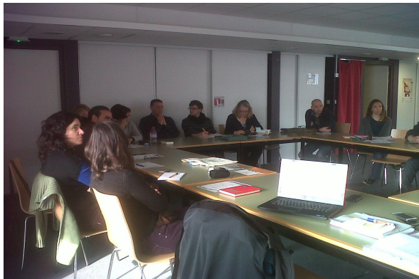
Foto: Presentation of participants