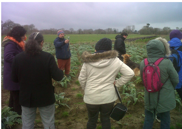
Foto. Visita Finca