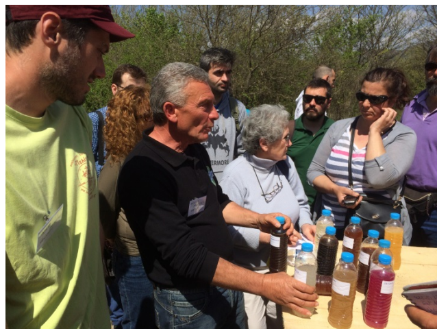
Foto 4. Un agricultor griego nos enseña sus preparados para combatir plagas o revitalizar los cultivos.