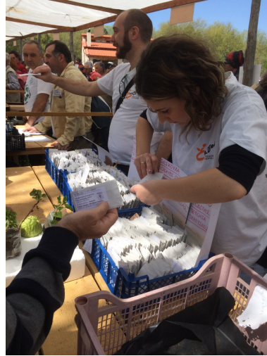
Foto 3. Día del intercambio. Una de las mesas repleta de sobres con semillas para repartir a los asistentes.