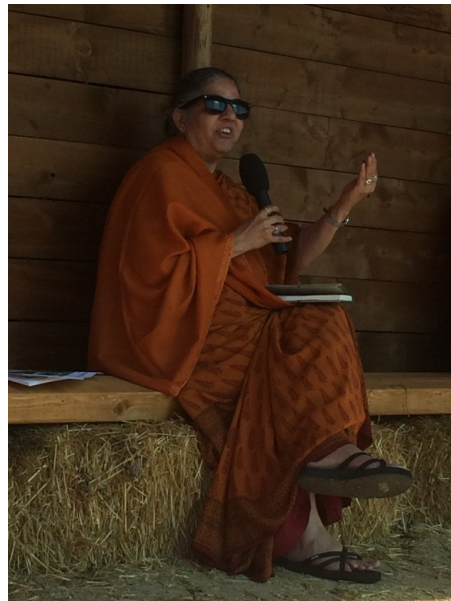
Foto 2. Vandana Shiva fue la encargada de inaugurar el encuentro.