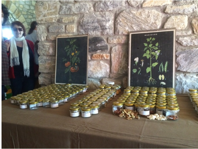
Foto 1. Interior de la "Casa de Semillas". Muestrario de las variedades conservadas.